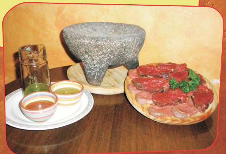
Molcajete de solomillo